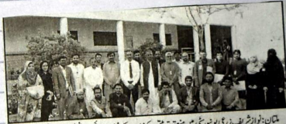
ملتان: نواز شریف زری یونیورسٹی میں منعقدہ تربیتی ورکشاپ کے شرکاء کا وائس چانسلر کے ہمراہ گروپ فوٹو

جلد 13 | منگل 21 جمادی الثانی 1438ھ | 21 مارچ 2017ء | 8 چیت 2073 ب صفحت 12 قیمت 13 روپے | شماره 64