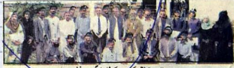
ملتان: تربیتی ورکشاپ کے شرکاء کا گروپ فوٹو